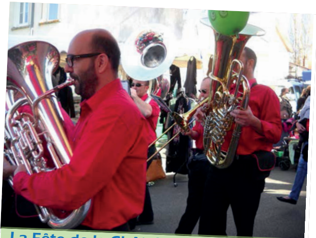
La Fête de la Châtaigne - 1 er nov. 2014