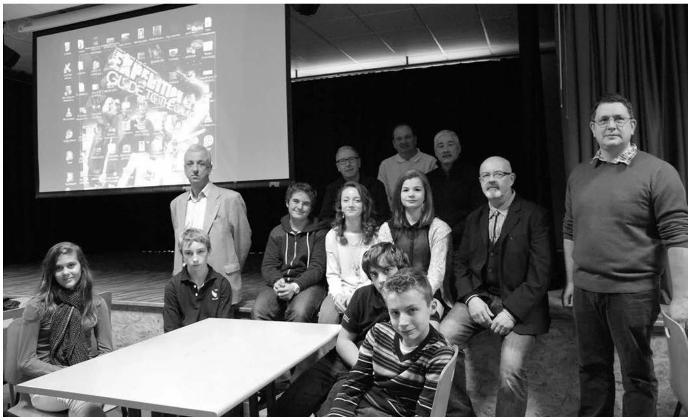
L'équipe ARISS 87 avec les élèves

tion avec l'ISS. Notre interlocuteur à bord sera Samantha Christoforetti, première femme italienne à aller dans l'espace. »