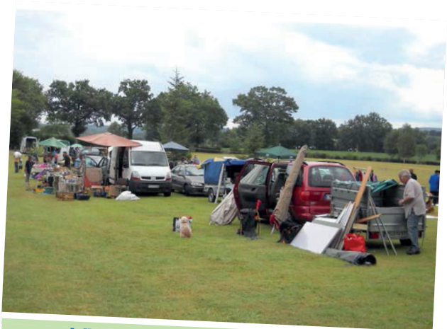
Vide-Greniers - 3 août 2014