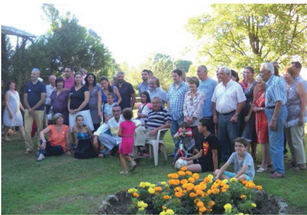
Repas de La Borderie - 6 sept. 2014