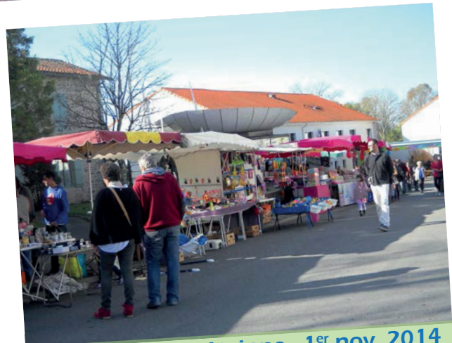
La Fête de la Châtaigne - 1 er nov. 2014