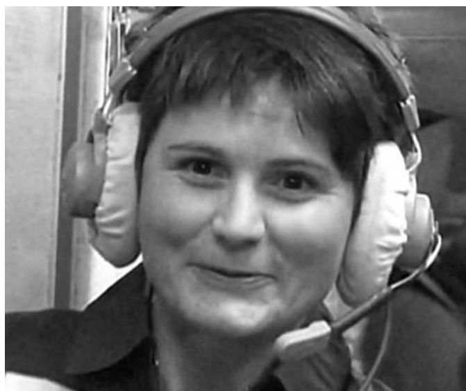
La station spatiale internationale